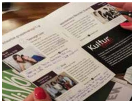
Noter om både dagens og årets koncerter deles.

For LMS er historien om The L Team og gensynet med mange andre kontakter år efter år et tegn på, at drømmen om festivaltraditionen efterhånden er