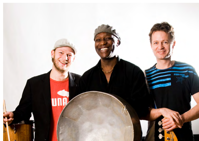
Goin' Back To New Orleans