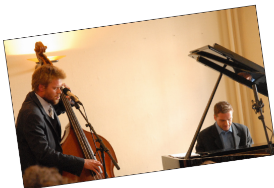
3. Eller måske snarere bas?...Hva' si'r du, Pojken?