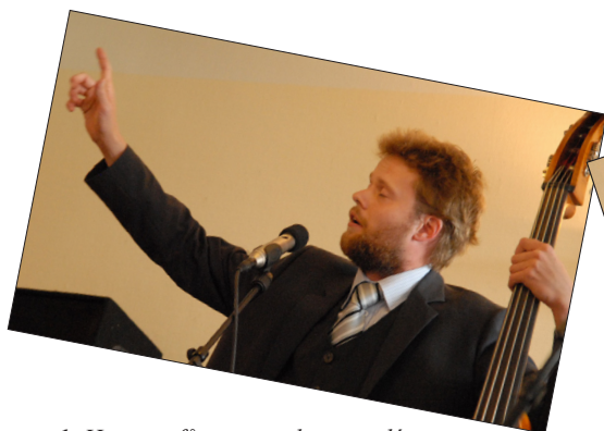
1. Hov, jeg får søreme lige en idé....

En anden mulighed kan være at improvisere ved hjælp af kroppen. Del børnene ind i grupper à 5-6 personer og lad hver gruppe lave fri dans og bevægelse til enten The First Frost (lydeksempel 3) eller Dick Turpin (lydeksempel 1). Øvelsen kræver koncentration og indlevelse, så måske er den bedst at udføre gruppevis (fx ved at klassen roterer holdvis mellem forskellige improvisationsøvelser med denne som et af stoppestederne). Gentag øvelsen et par gange. Pluk i hver runde de bedste/sjoveste/mærkeligste/mest følsomme osv. danse-/bevægelselementer ud fra improvisationen, og sæt dem sammen til en sekvens. Indøv sekvensen, og vis den for de andre, mens musikken spiller.