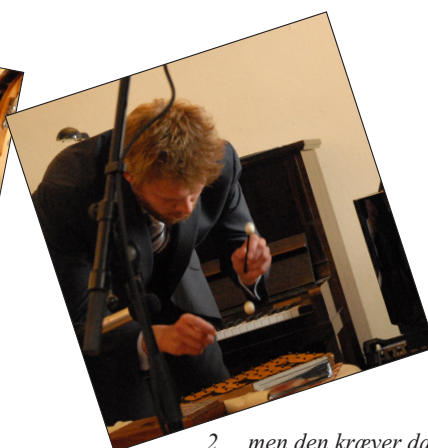
2. ...men den kræver da vist klokkespil..?